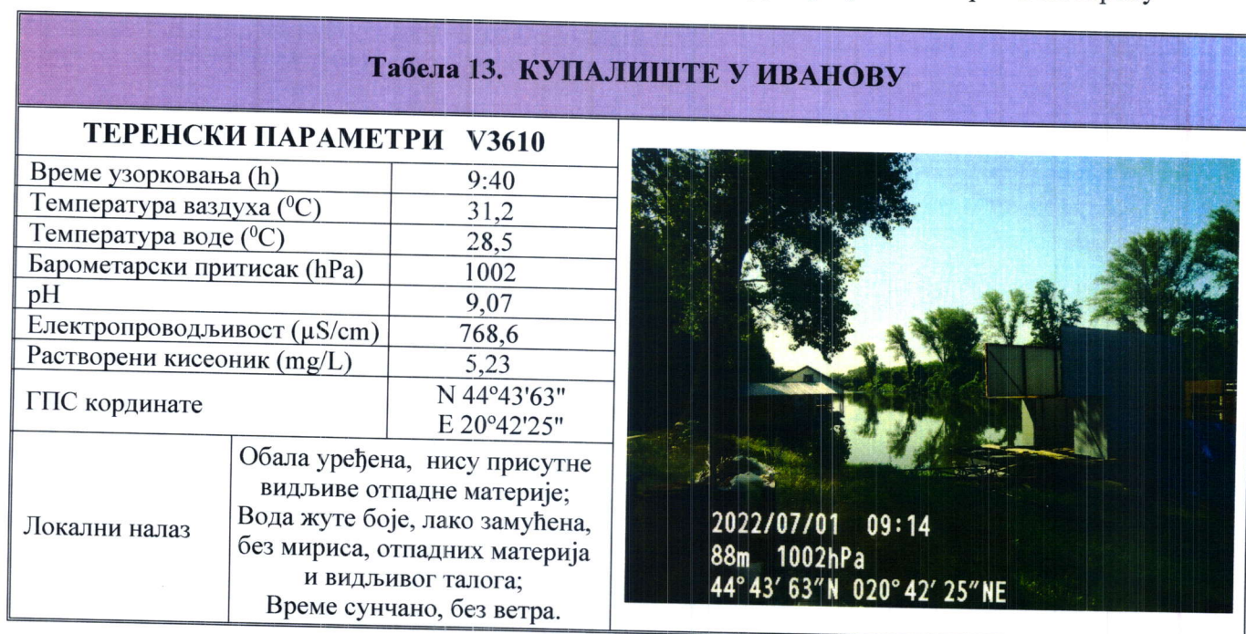
Табела 13. Извештаји о извршеном хигијенском надзору и резултати мерења на терену