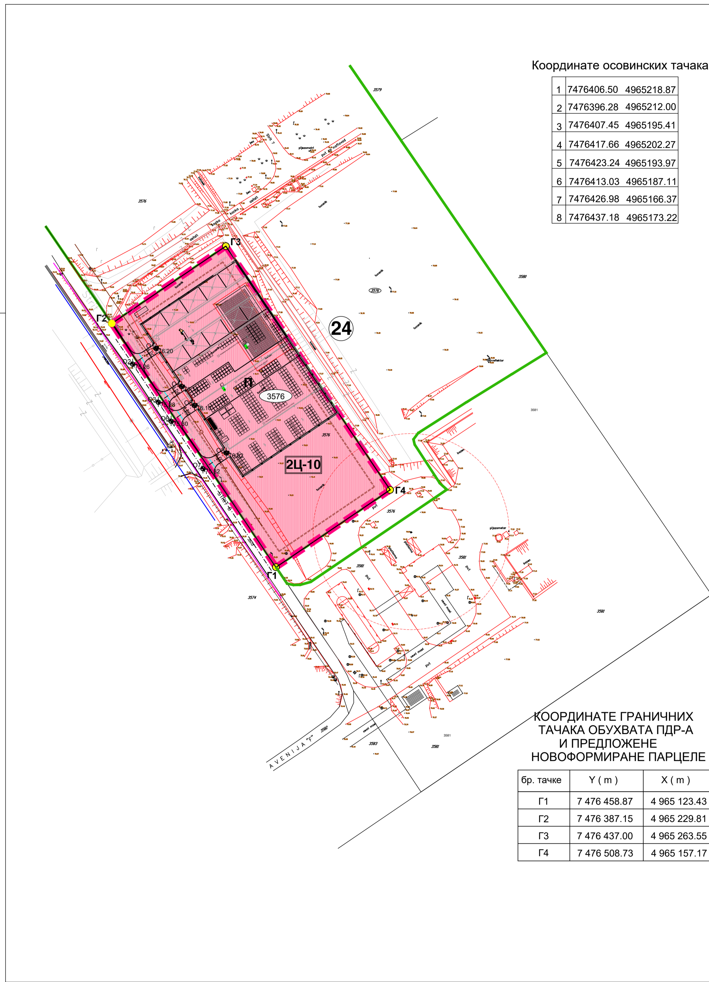
Координате осовинских тачака