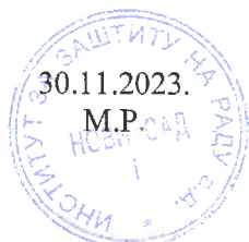
Danijela Bekrić, dipl. hemičar Šef odseka za fizičko-hemijska ispitivanja