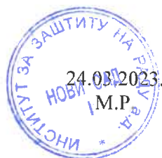
Danijela Bekrić, dipl. hemičar Šef odseka za fizičko-hemijska ispitivanja