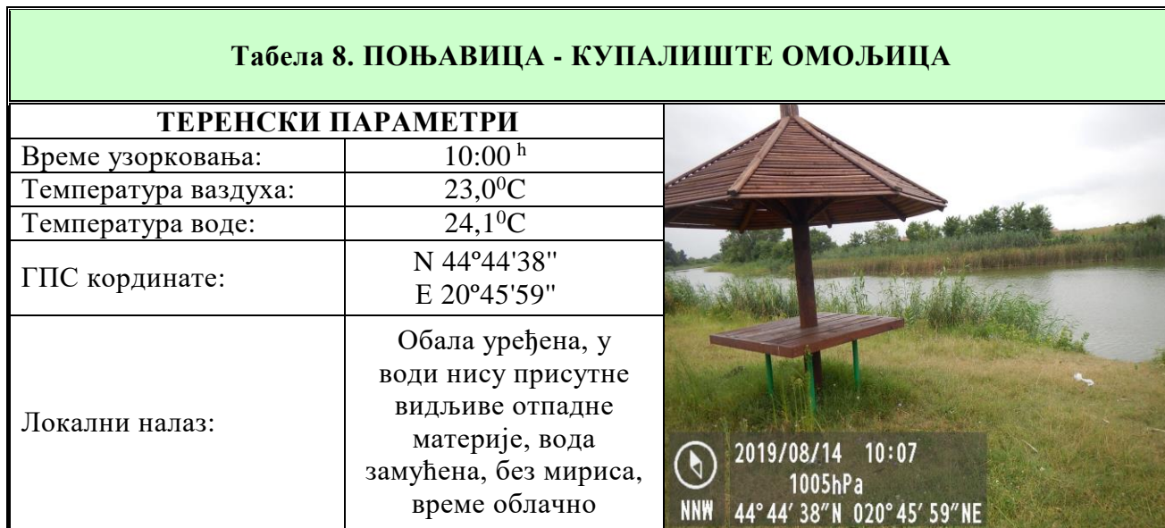
Табела 8-9. Извештаји о извршеном хигијенском надзору и резултати мерења на терену