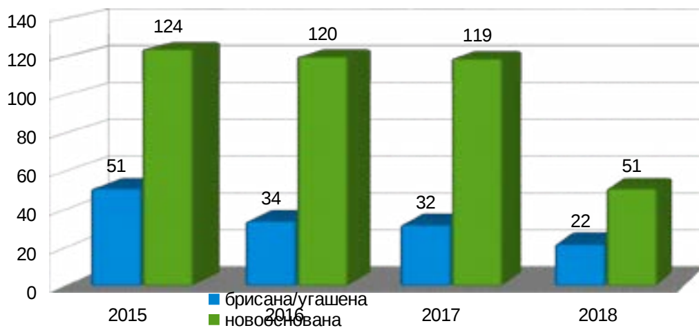
Брисана/угашена и новооснована привредна друштва 2015-2018